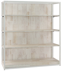
ホワイトフレーム 棚什器