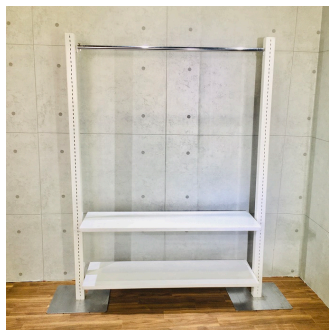
ウォーキングホワイト (システム什器)