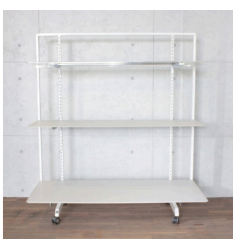
スチールシェルフホワイト (システム什器)