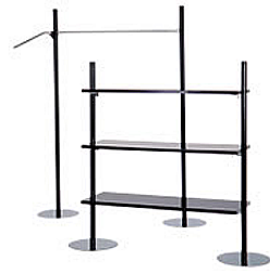
ニューウォーク (システム什器)