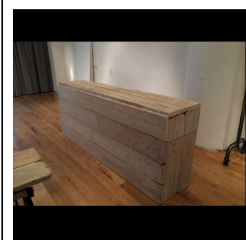
ディスプレイ・ステージ 古材カ ウンター