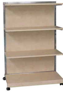
Square スクエア棚什器 (メープル)