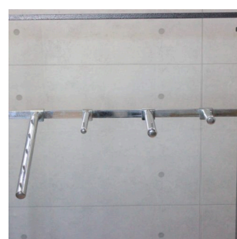
角バー用ナナメフック・ストレ ートフック