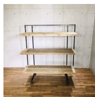
ディスプレイ 古材棚什器