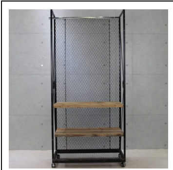
ワイアット (システム什器)