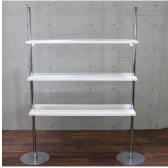
ニューウォーククローム (システム什器)