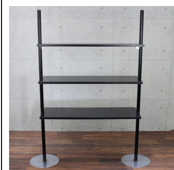
ニューウォークブラック (システム什器)