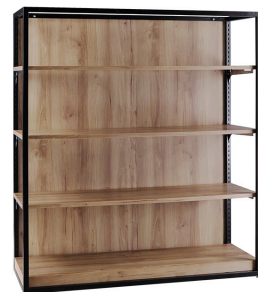
ブラックフレーム棚什器