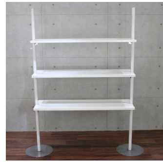
ニューウォークホワイト (システム什器)