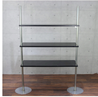
ニューウォークユニクローム (システム什器)