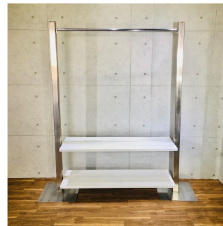
ウォーキングホワイトブロンズ (システム什器)