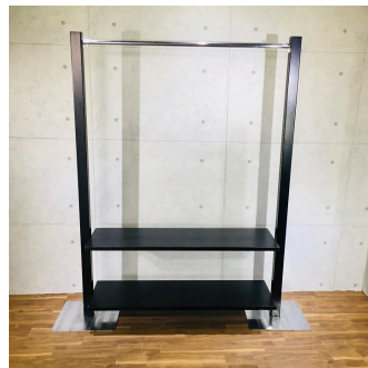
ウォーキングブラック (システム什器)