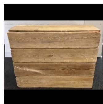
ディスプレイ・ステージ 古材カ ウンター (小)