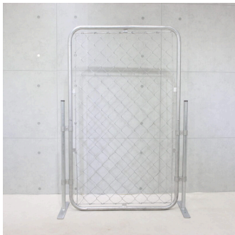
アメリカンフェンス