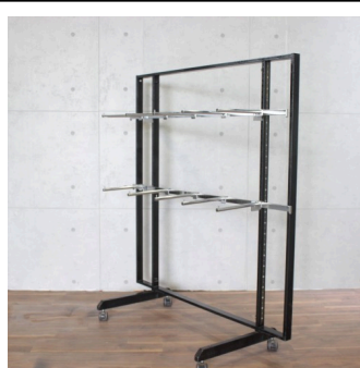
スチールシェルフ2 (システム什器)