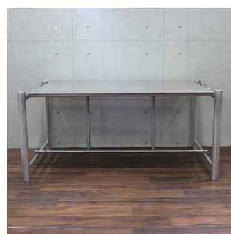
ロスモードテーブル/アルミ・ ディスプレイ・角テーブル (アルミ材)