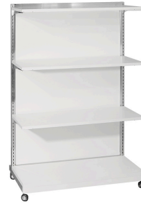
Square スクエア棚什器 (ホワイト)