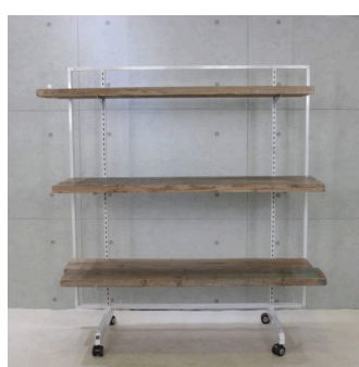
ディスプレイ 古材棚什器 (ホワイトフレーム)