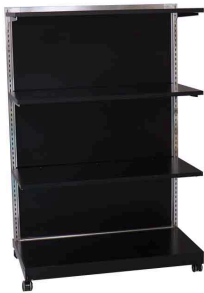
Square スクエア棚什器 (ブラック)