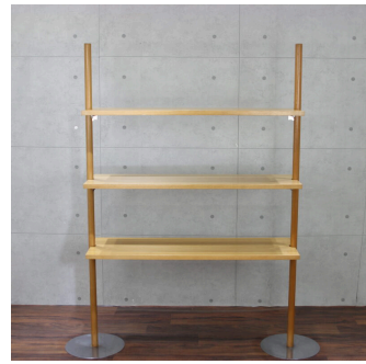
ニューウォークキナリ (システム什器)