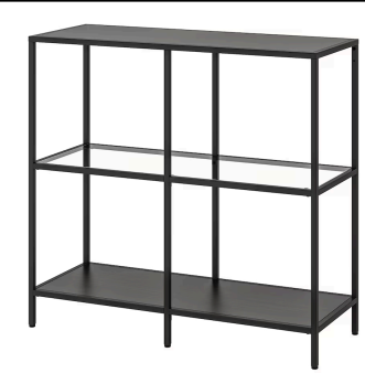
ガラス棚什器 (ブラック) 1