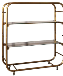
クルヴァ棚什器 (アンティークゴールド)