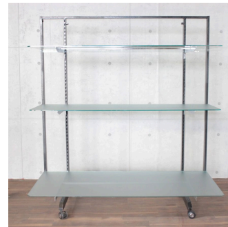
スチールシェルフ (システム什器)