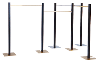
ウォーキングシリーズ (システム什器) 棚、ハンガー バー什器