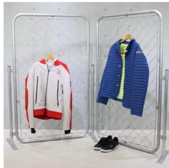
アメリカンフェンス使用例