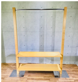
ウォーキング木調 (システム什器)