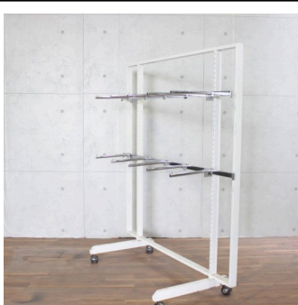
スチールシェルフホワイト2 (システム什器)